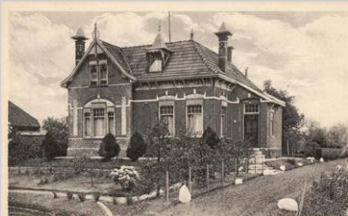
Villa van den Burgemeester. Grootegast.