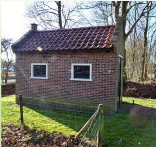
Replica baarhuisje Opende op themapark de Spitkeet

In 1872 wordt op de algemene begraafplaats te Opende een lijkenhuisje (of baarhuisje) gebouwd.