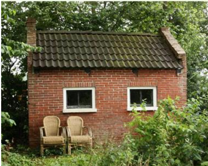
Het originele lijkenhuisje op de voormalige algemene begraafplaats in Opende

Na uitbreiding van het kerkhof bij de kerk in Opende raakte het armenhof in ongebruik.