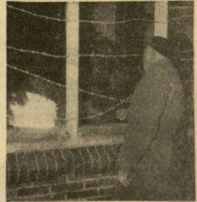
Burgemeester H. van Ek laat de rode haan kraaien.

In dit dorp is de laatste vijf jaar een heel andere mentaliteit gegroeid ten opzichte van de woontoestanden. In deze vijf jaar werden er 71 particuliere woningen gebouwd, vooral door arbeiders. Men wil de oude woningen niet meer